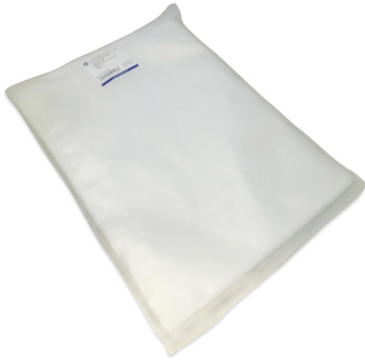
Imagem do pacote