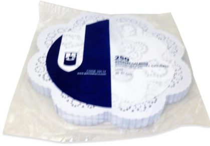
Imagem do pacote