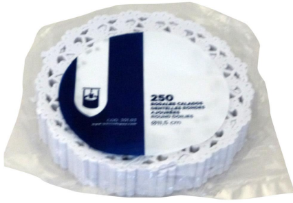
Imagem do pacote