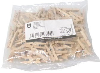
Imagem do pacote