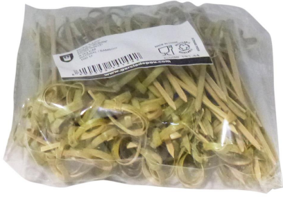
Imagem do pacote