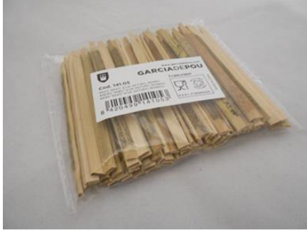
Imagem do pacote