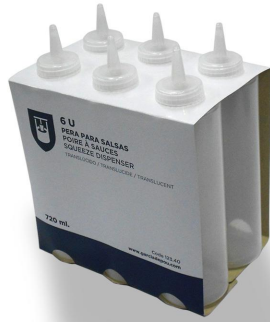
Imagem do pacote