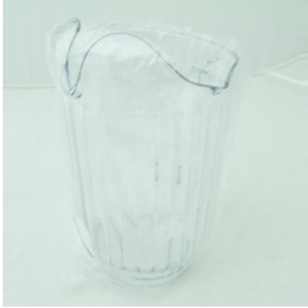
Imagem do pacote