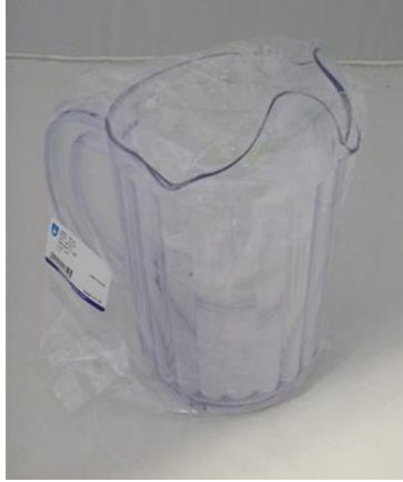
Imagem do pacote