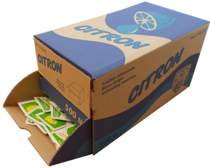
Imagem do pacote